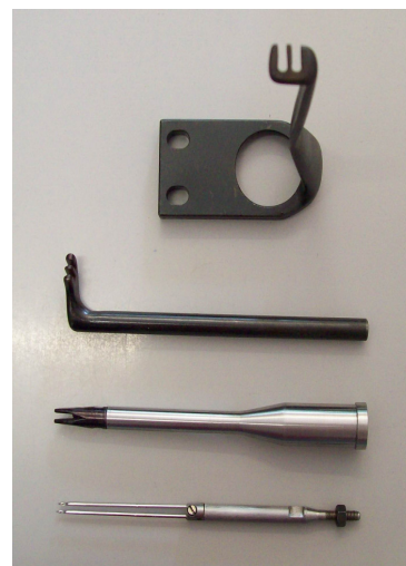
Pezzi che compongono la testina a 2 ago Parts forming the 2 -needle post Piezas que componen el poste de 2 aguja