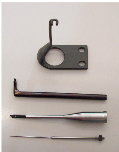
Pezzi che compongono la testina a 1 ago Parts forming the 1 -needle post Piezas que componen el poste de 1 aguja

Cambio de engranajes semi-automatico para discos con 18,12,9,4,3 ventanas Separacion entre puntadas de 0 a 4 mm Postes posibles con 1, 2 y 3 agujas Poste de 1 aguja para cabezas con abertura minima cuello de 16 mm diametro Poste de 3 agujas para cabezas con abertura minima cuello de 22 mm diametro Motor tipo de embrague – mando con pedal – 0,5 HP Coda aguja, 800-1000 puntadas por minuto Espacio ocupado Peso neto, 175 Kg